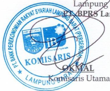
OKMAL Ketua Komisaris